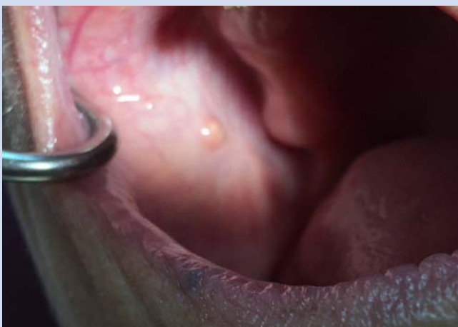
1 Der störende Speichelstein in der Parotis.

Sehr praktisch beim neuen Laser sind die Voreinstellungen. Ich wähle die Indikation, die Laser-Parameter stellt das Gerät automatisch richtig ein. Ich kann die Programmierung individuell anpassen, aber während der Behandlung muss ich mich nicht jedes Mal mit technischen Einstellungen befassen. Das spart Zeit und erhöht die Sicherheit für mich und den Patienten. Die Nutzerfreundlichkeit wurde gegenüber dem Vorgängermodell nochmal verbessert. Ich kann wie bei einem Tablet einfach über den Touchscreen navigieren.