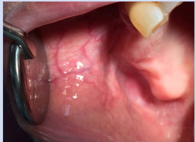
5 Tadellos geheiltes Gewebe nach einem Monat.

Nach einer einfachen Oberflächenanästhesie ließ sich das ca. 3 mm große Konkrement mit der blauen Diode innerhalb weniger Augenblicke freilegen. Es kam zu keiner nennenswerten Blutung, eine Naht war nicht erforderlich. Die Wunde granulierte spontan und ist komplikationslos verheilt. Die Patientin war mit dem Ergebnis der Behandlung sehr zufrieden.