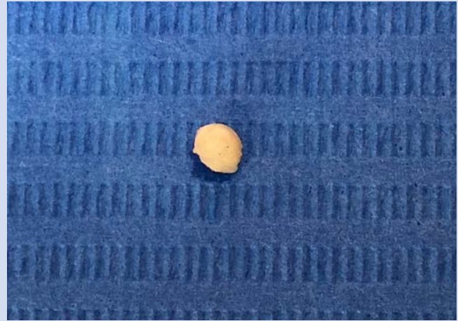
4 Entfernter Speichelstein.