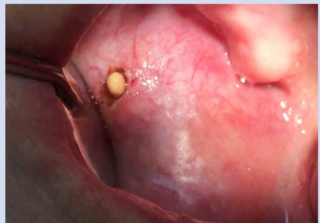
2 Der Speichelstein wird bei der OP freigelegt